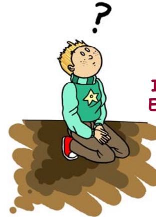
INTELIGENCIA EXISTENCIAL Ó ESPIRITUAL